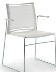
C 21 M