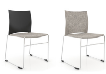
Polstervarianten sind erhältlich.